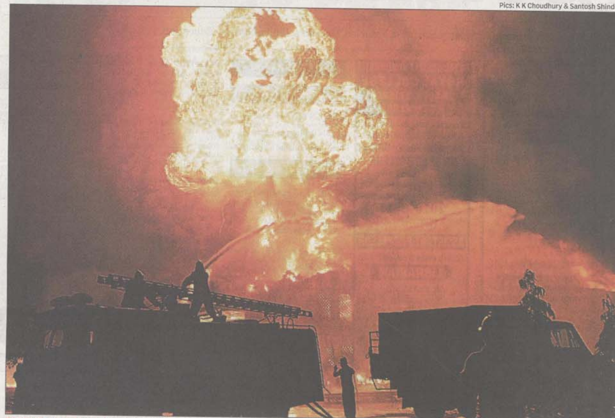
TAMING AN INFERNO: According to officials, a short-circuit may have triggered the mishap

"Lube oil is basically a 'C' class petroleum product, and so it is not highly inflammable like refined petrol or diesel.